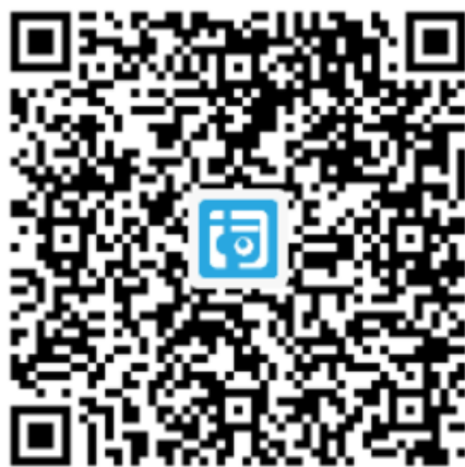
山东政法学院专用 2026年大赛学 生报名二维码

报名时间为即日起至 2026 年 4 月 30 日。参赛选手务必先关注微信公众号“词达人”，进入“学生端”，使用右上角的“扫一扫”功能，扫描下方的本校专属报名二维码。进入报名界面后，参赛选手须如实填写本人姓名、学号、组别等信息，确认提交完成报名。请注意：填报信息与竞赛成绩、获奖证书挂钩，如果填报错误或经核查不实，将被取消竞赛成绩。